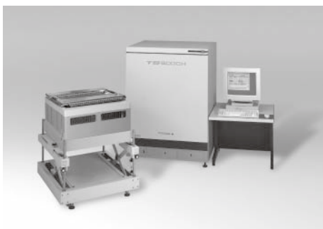
高速 SoC テストシステム TS6000H+

10月末には、米国電子技術者協会(IEEE)で標準化されたテストデータ記述言語STIL(スタイル)を導入し、世界初の画期的なテスト・オープンシステム「STIL/TestHighway」を開発しました。これにより、システムLSIの開発過程に使用するEDA(Electric Design Automation)ツール、故障解析ツール、各種テストなどのテスト言語の統一が図れ、開発からテストまでの回転期間や故障解析にかかる時間を大幅に短縮、テストコストを削減することができます。