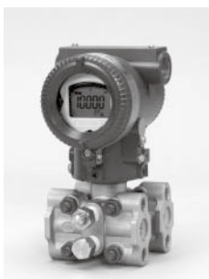
差圧・圧力伝送器 DPharp EJX

当社は、今後も継続した開発投資を通じて、高性能・高信頼性の製品を投入し続け、世界No.1を目指す戦略を展開していきます。