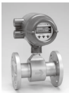
電磁流量計 ADMAG AXF