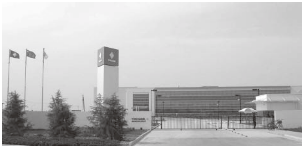
横河電機(蘇州)有限公司

海外の生産拠点については、昨年10月に設立した中国地域統括会社「横河電機(蘇州)有限公司」の本社・工場の第1期工事がこのほど無事竣工し、10月1日から稼働を開始しました。